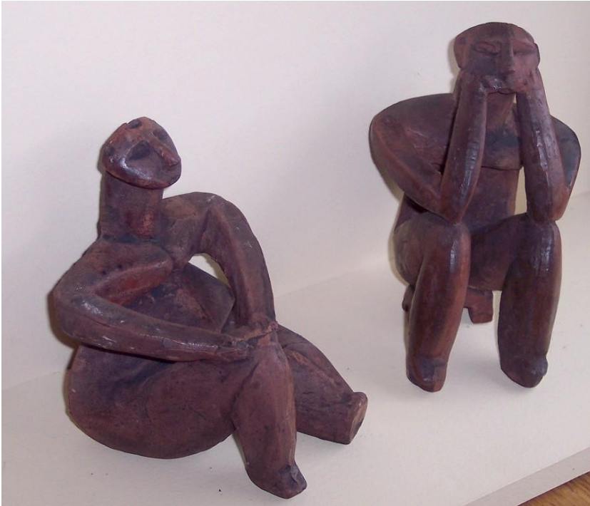
« Le penseur et sa femme » civilisation danubienne (Roumanie) -7500 ans BP

Chacun d'entre nous sait qu'il est , sait qu'il sait . Chacun est capable de mettre en relation des faits passés avec des situations présentes et en envisager les conséquences futures. Chacun est capable de concevoir et de fabriquer des outils, de modifier son environnement...Et bien d'autres choses encore.